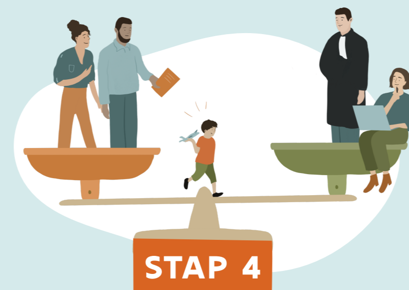
DE ANALYSE EN DE AFWEGING