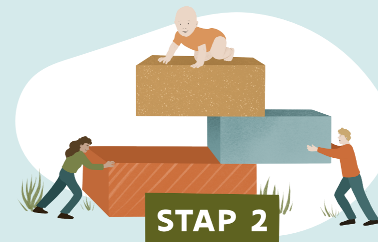
HET KIND OF DE JONGERE BETREKKEN