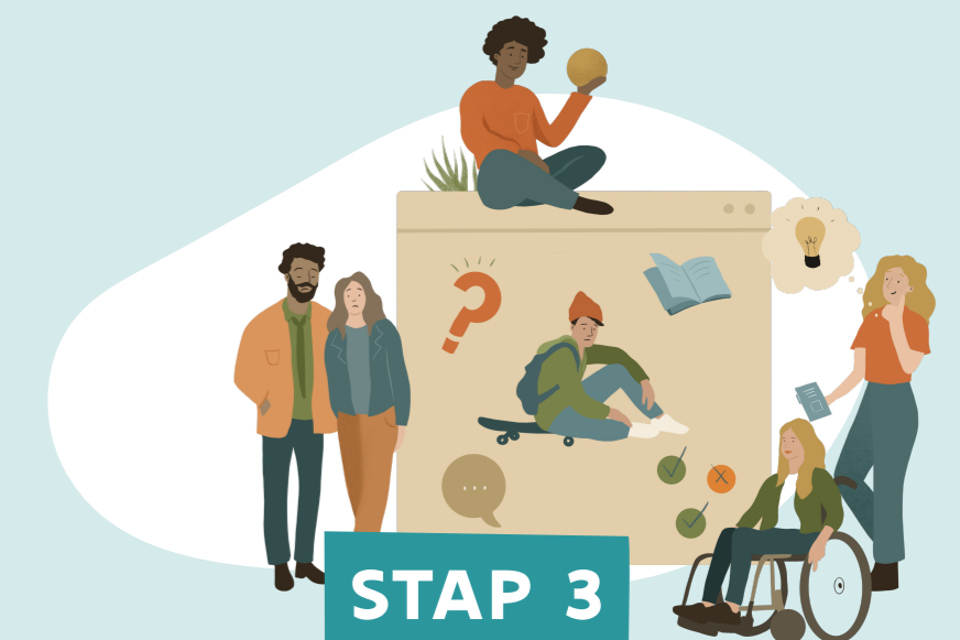
DE SITUATIE EN DE VRAAG