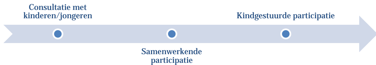
Figuur 1 – Vormen van participatief onderzoek